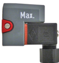
Contact Z42 / Z40